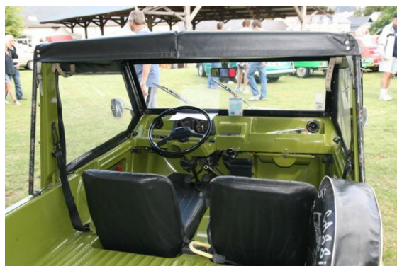
Ett par franska transportbilar som man inte ser så ofta i Sverige.